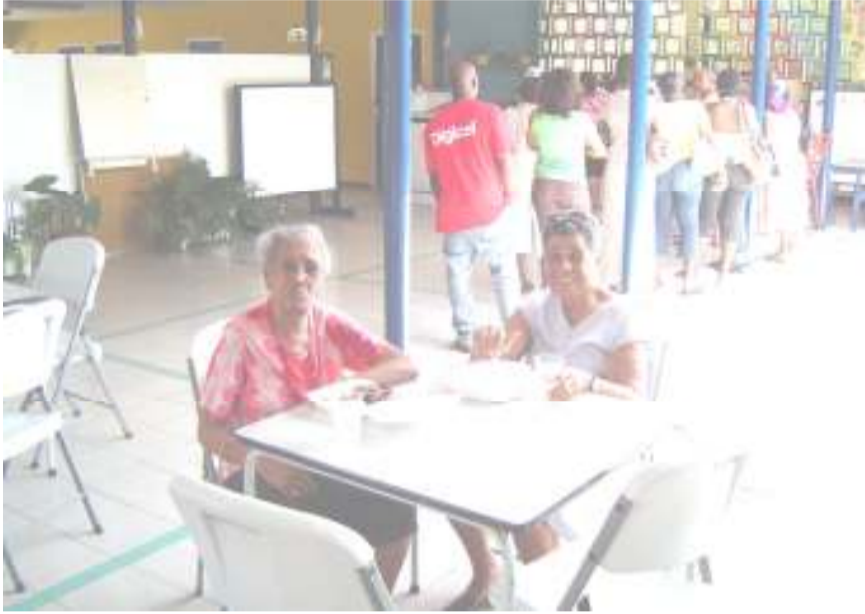
Onze "rijpere jeugd" liet zich het eten goed smaken.