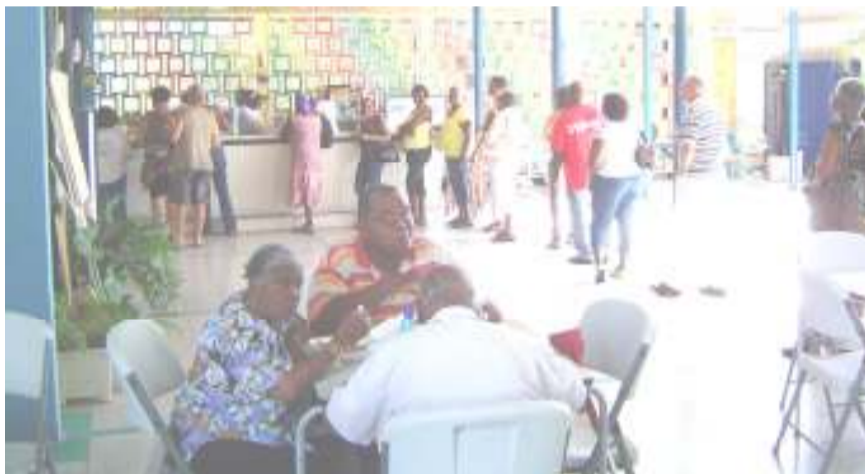
Men genoot zienderogen van het heerlijke eten. Een compliment aan de koks. Het was een succes.