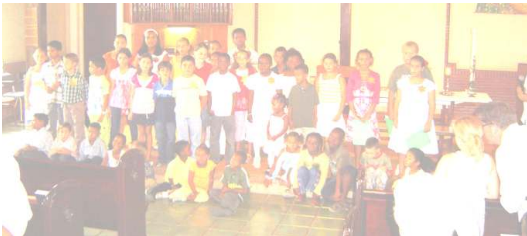
De kinderen die meegedaan hebben aan de gezin-school-kerkdienst gehouden op 24 mei 2009 in de Emmakerk