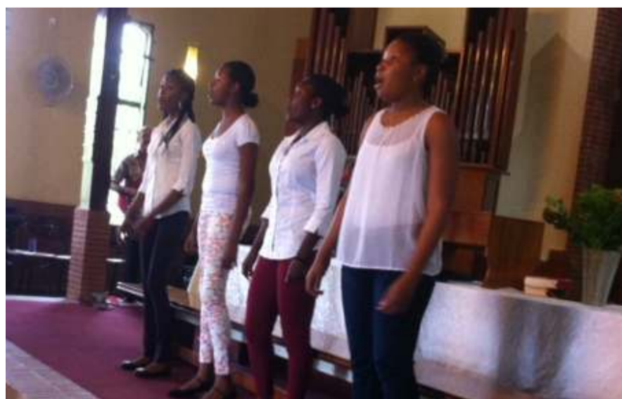
Het Maranatha jongerenkoor