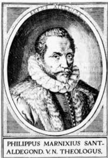
PHILIPPUS MARNIXIUS SANT-ALDEGOND. V.N. THEOLOGUS.

In 1568 voltooit Marnix te Embden (Duitsland) zijn Byencorf der Heilige Roomsche Kerke. Een jaar later komt dit geschrift voor het eerst uit. Het is later vele malen herdrukt. Hij weerlegt hierin de leerstellingen van de Rooms-Katholieke kerk. Het is geschreven in de vorm van een satyre. Ook schrijft Marnix adviezen aan de Nederlandse vluchtelingengemeente in Londen. In deze dagen wordt ook het Wilhelmus geschreven. Het is niet zeker of dit van de hand van Marnix is. Ook wordt Marnix door keurvorst Frederik III van de Palts benoemd tot lid van de Kerkenraad van Heidelberg, een soort "opperkerkenraad". Deze raad gaat uit van de gedachte, dat de christelijke overheid ook voor het eeuwig heil en het kerkelijk welzijn van haar onderdanen te zorgen heeft.