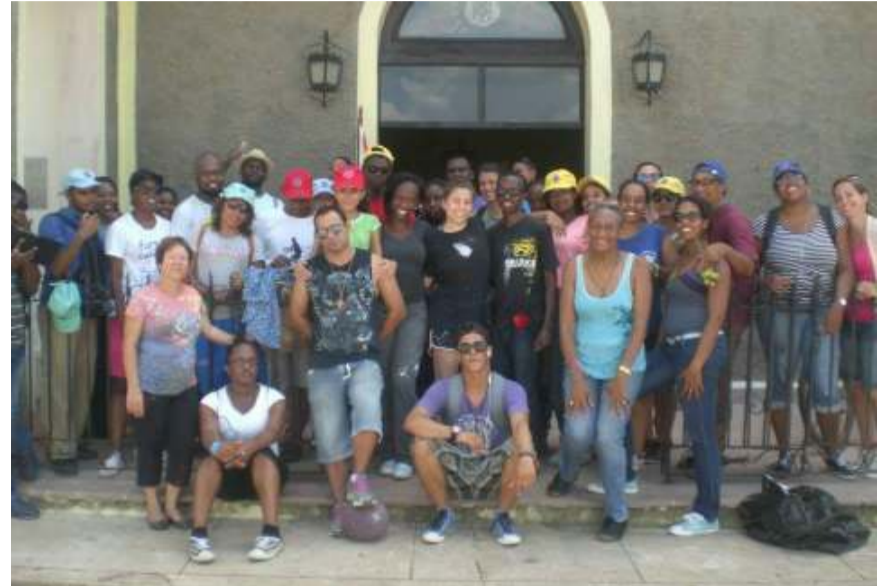
YAM 2015 attendents