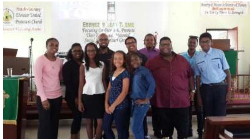
VPG Youth Service