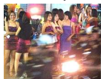
Prostitution is a $4.3 billion industry in Thailand.